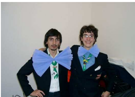
Partecipanti allo stage di Espressione tenuto dalla “Pattuglia sorriso”