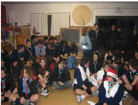
Il momento di incontro iniziale presso la sede di reparto di Sacile